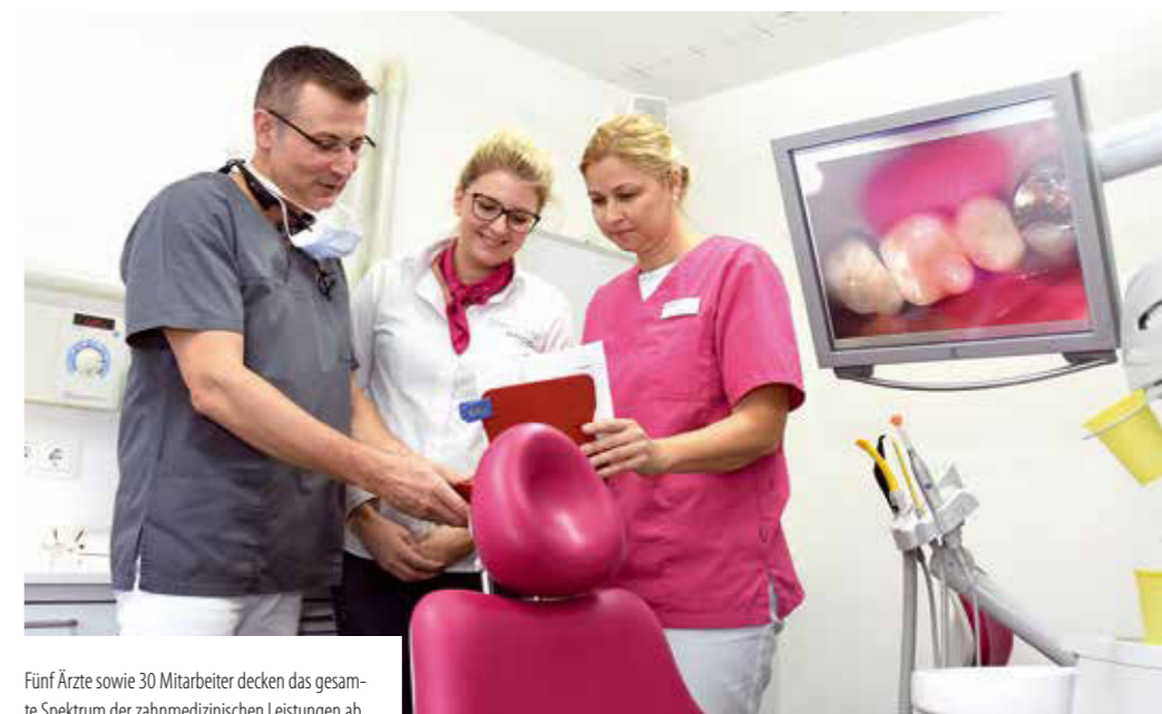
Fünf Ärzte sowie 30 Mitarbeiter decken das gesamte Spektrum der zahnmedizinischen Leistungen ab

mentomographie, Laseranwendungen, Ozon-Behandlungen und die ultraschallbasierte Piezosurgerymethode im Bereich der Knochenchirurgie zur Verfügung.